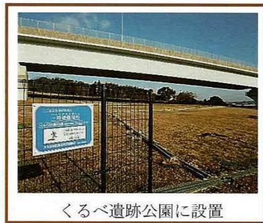
くるべ遺跡公園に設置