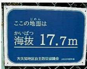
③ 海拔 15m 以上