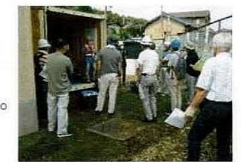
「防災倉庫備品説明」