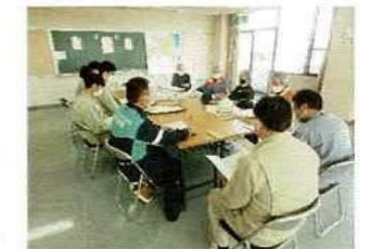
「市職員との意見交換」