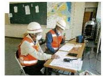
「本部災害対策本部」