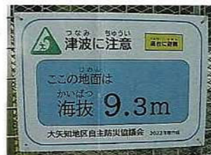
② 海拔 5m～15m 間