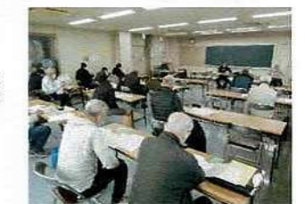
「災害別避難行動説明」