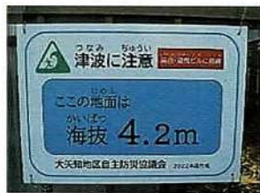
① 海拔 5m 以下