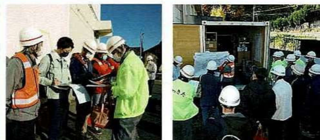
【大矢知興譲小学校 訓練状況】