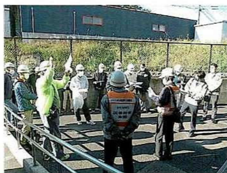
「大矢知興譲小学校避難所開設訓練」