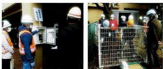
【あさけプラザ 訓練状況】

11月14日(日) あさけプラザ体育館、12月5日(日)大矢知興譲小学校で避難所開設手順等の勉強会を行いました。防災倉庫の防災資機材についての説明で、多くの意見を頂きました。