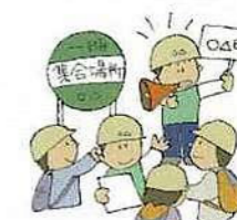
「参加者の皆様、ご苦労様でした」