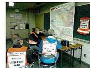
「本部情報受信訓練」