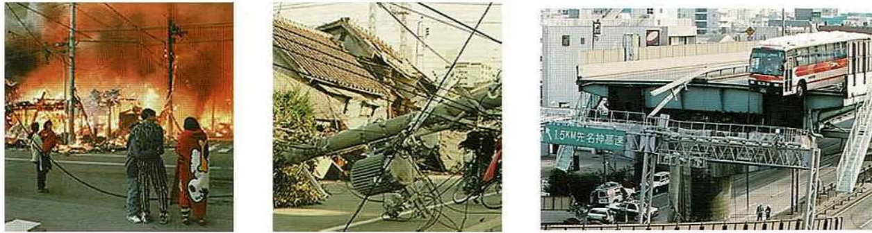
朝日新聞 HP より「神戸市内の被害状況」

また、家屋被害は、全壊が約 10 万 5 千棟、半壊が約 14 万 4 千棟にのぼった。