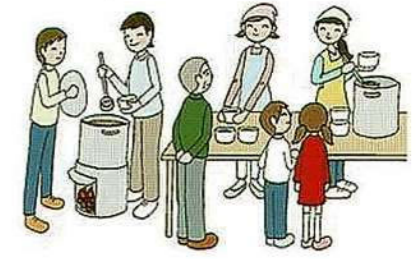
食べ物を配ります。日時 (Date)